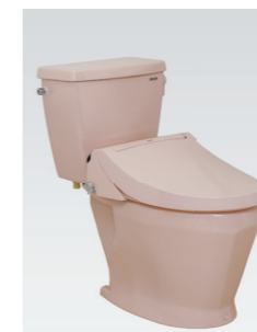
DXAK-570 P, MA32