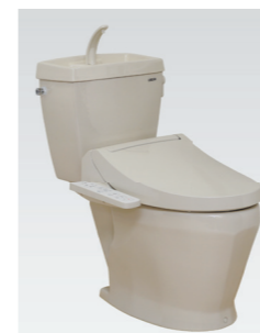
DXAK-570 FW, MB31